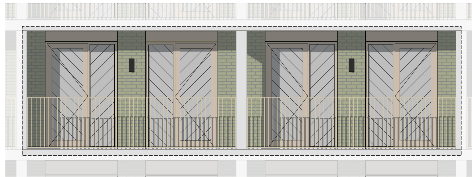
Westgevel | balkonzijde