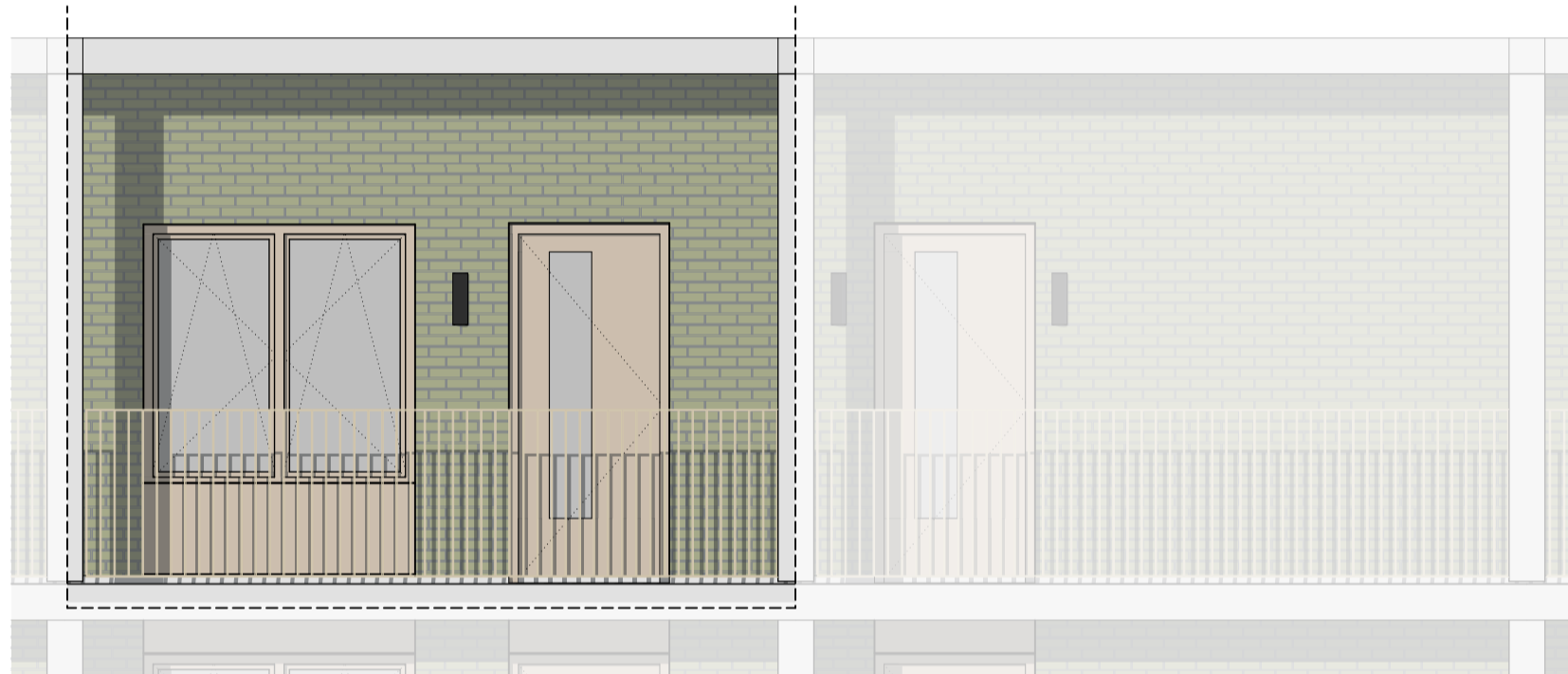
Oostgevel | galerijzijde