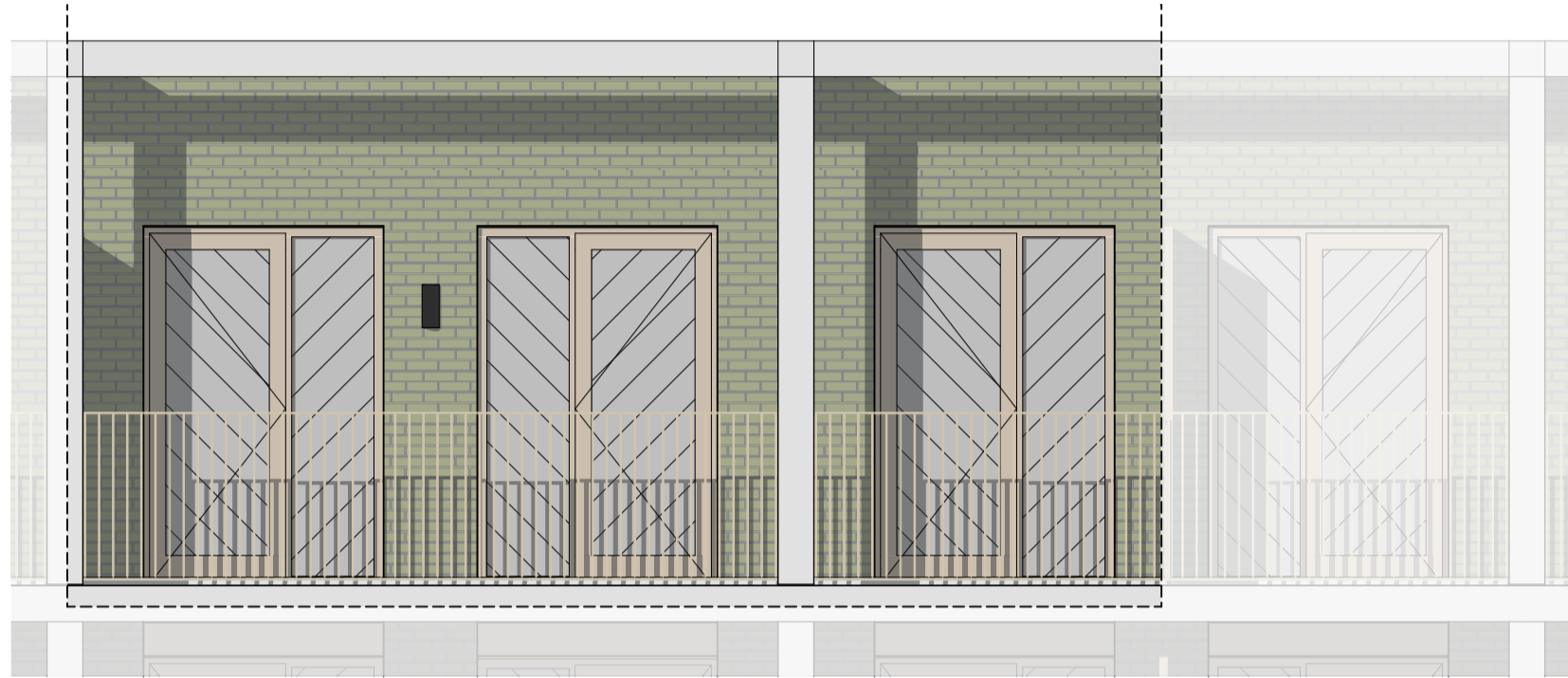
Westgevel | balkonzijde