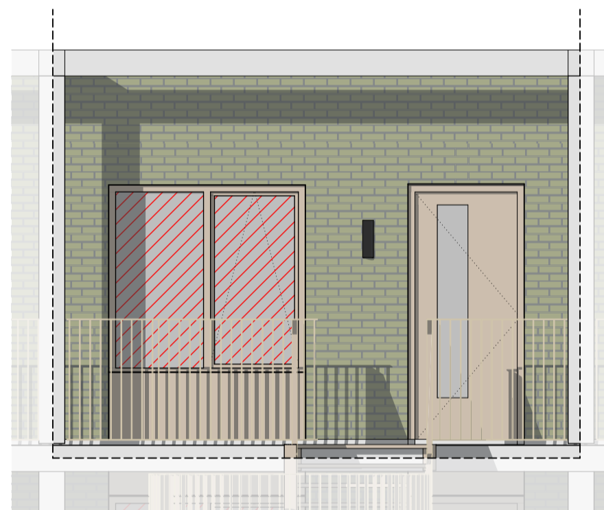
Oostgevel | galerijzijde