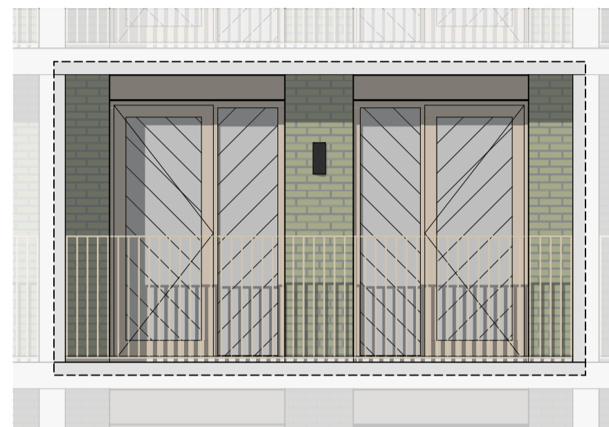
Westgevel | balkonzijde