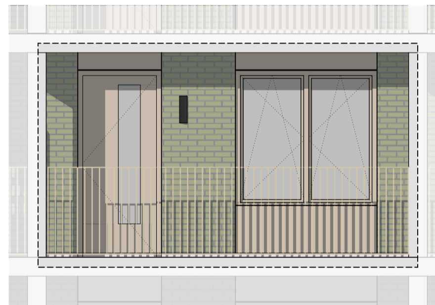
Oostgevel | galerijzijde